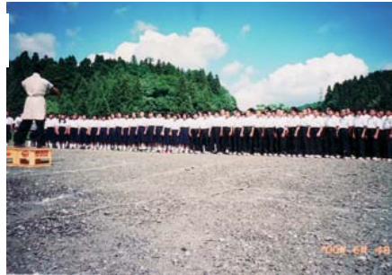
中条中学生全員の大合唱”圧巻”