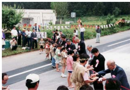
縄文人と現代人 そろってテープカット。

じょうもん市のために女性たちを中心に地域の方々がたいへんな手間と時間をかけて20着ほどの縄文服をつくっていただきました。