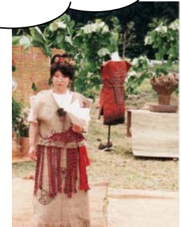
あでやか縄文ファッション。