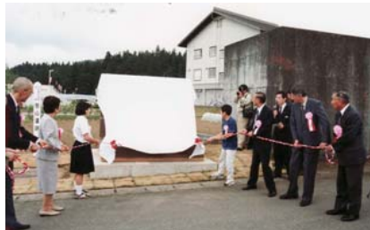
モニュメント除幕式 なつかしい顔・顔。