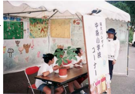
おそばおいしいです。