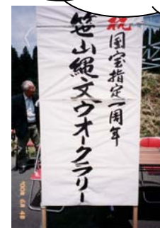
縄文の里を歩きました！