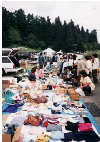
フリーマーケットおおにぎわい。